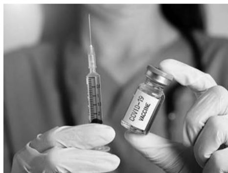
Вакцина - лучшая защита!

Администрациям ТЦ и заведений общепита запрещается принимать детей до 14 лет группами более трех человек без сопровождения родителей, а также без средств индивидуальной защиты и соблюдения социальной дистанции.