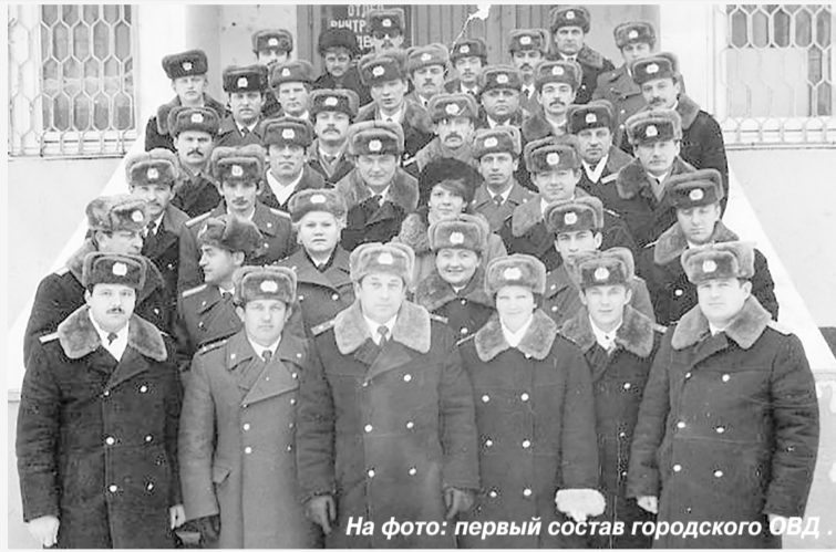
На фото: первый состав городского ОВД.

помещении располагался изолятор временного содержания. Целые службы и подразделения приходилось создавать практически на пустом месте. Трудности были со средствами связи, транспортом, вооружением. Техническое оснащение составляло всего два мотоцикла, два стареньких «УАЗика» и один автомобиль для перевозки арестованных. Первый легковой автомобиль - в простонародье «копейка» - был получен лишь спустя два года после образования отдела и списан только в 1999 году. Территория обслуживания распространялась от месторождения Приграничное (3 км от Ноябрьска) на 100 км в сторону Сур-