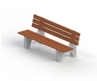
Диван садово-парковый на железобетонных ножках