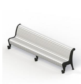
Диван садово-парковый на чугунных ножках