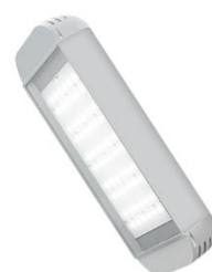
Светильник уличный светодиодный