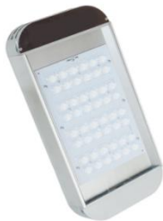
Светильник уличный светодиодный