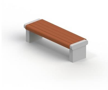
Скамья садово-парковая на железобетонных ножках