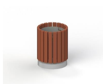
Урна деревянная на ж/б основании с металлической вставкой