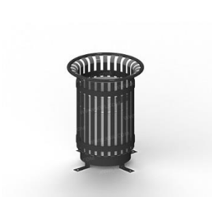
Урна металлическая с окрашенной вставкой