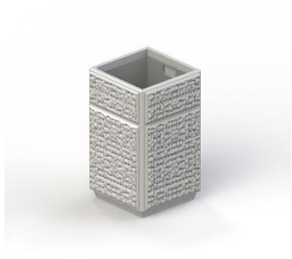
Урна железобетонная с металлической вставкой