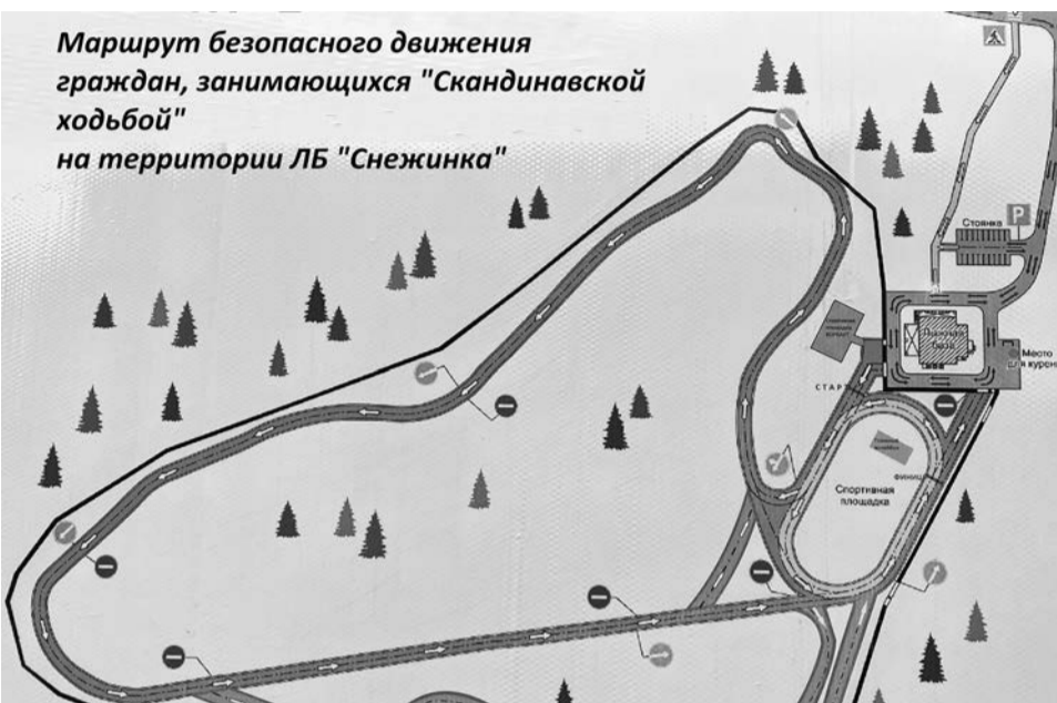
Маршрут безопасного движения граждан, занимающихся "Скандинавской ходьбой" на территории ЛБ "Снежинка"

Скандинавская ходьба - это оригинальный и несложный метод оздоровления и фитнеса, которым увлечены миллионы людей по всему миру. В Когалыме этот вид спорта тоже с каждым годом становится все популярнее.