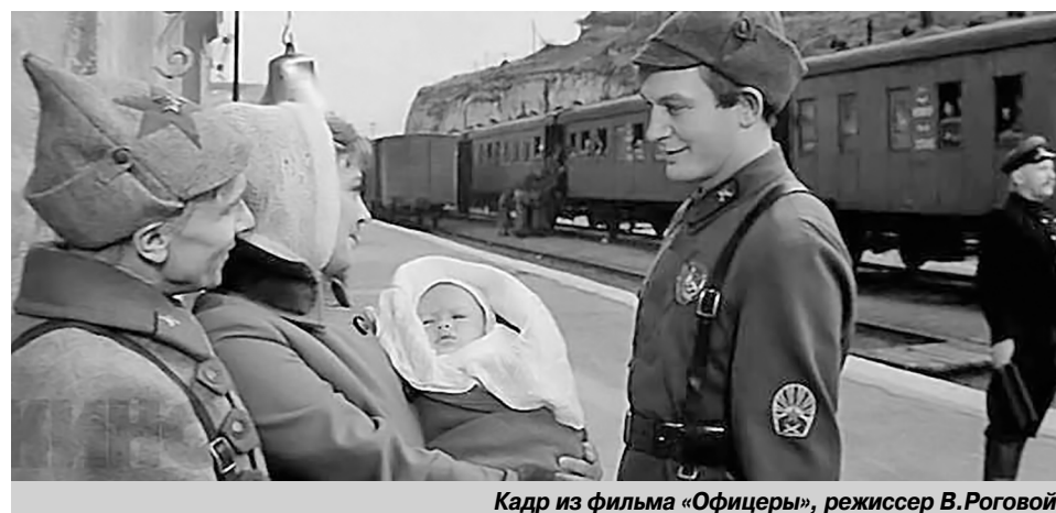
Кадр из фильма «Офицеры», режиссер В.Роговой.