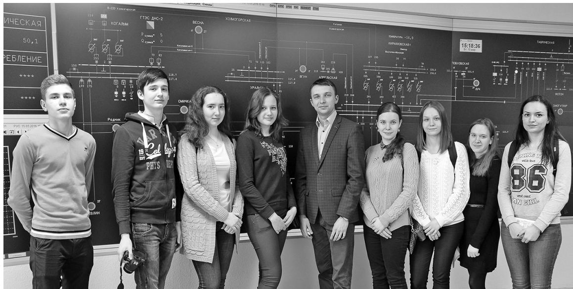
Филиал АО «Тюменьэнерго» Когалымские электрические сети поддержал Всероссийский проект «Школьная лига РОСНАНО». Это образовательная программа, целью которой является продвижение в российских школах идей, направленных на развитие современного образования, в первую очередь - естественнонаучного.

Взаимодействие было организовано в рамках Пятой Всероссийской школьной недели высоких технологий и техно-предпринимательства, где одним из мероприятий была запланирована деловая игра «Журналист: город будущего - smart city?..». Ученики средней школы № 3 должны были изучить, как и где работают высокие технологии и как они помогают городу быть «умным». Важным направлением журналистского расследования было названо энергоснабжение города в силу его значимости. Один из главных вызовов для города будущего - разработка технологий, позволяющих разумно тратить энергию и получать ее из возобновляемых источников максимально экологичным путем.