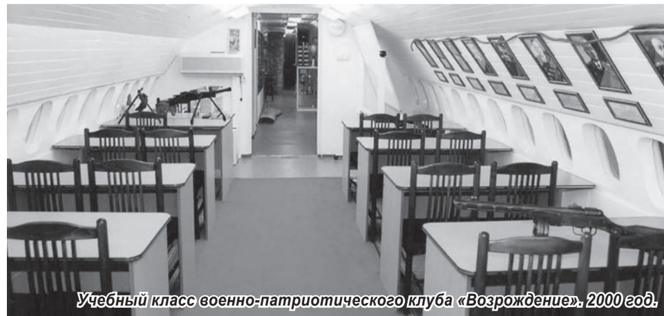
Учебный класс военно-патриотического клуба «Возрождение», 2000 год.

Подготовлено архивным отделом Администрации города.