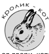
КРОЛИК - КОТ

Годы рождения Тигра: 1950, 1962, 10974, 1986, 1998, 2010.