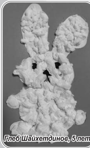
Глеб Шайхетдинов, 5 лет