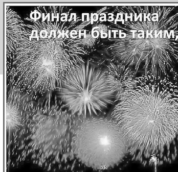
Финал праздника должен быть таким,

При работе с пиротехникой категорически запрещается курить. Нельзя стрелять из ракетниц вблизи припаркованных автомобилей. В радиусе 50 метров не должно быть пожароопасных объектов. При этом зрителям следует находиться на расстоянии 35 метров от пусковой площадки фейерверка, обязательно с наветренной стороны, чтобы ветер не сносил на них дым и несгоревшие части изделий. Категорически запрещается использовать рядом с жилыми домами и другими постройками