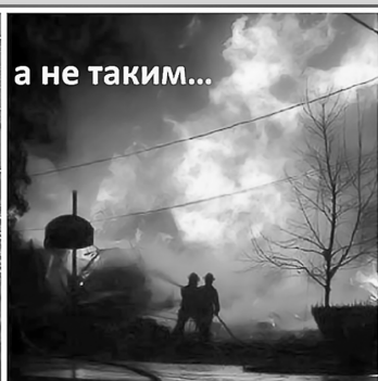
а не таким...

Соблюдайте правила использования пиротехнических изделий