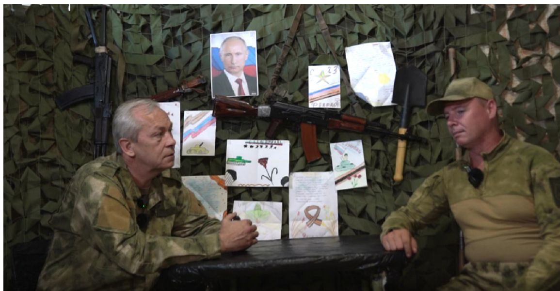
Саперы в Вооруженных силах РФ – это те люди, от которых зависит и успех обороны, и успех наступления

– Приезжали инструкторы, очень многое показывали и рассказывали – о постановке мин, о разминировании, об инженер-