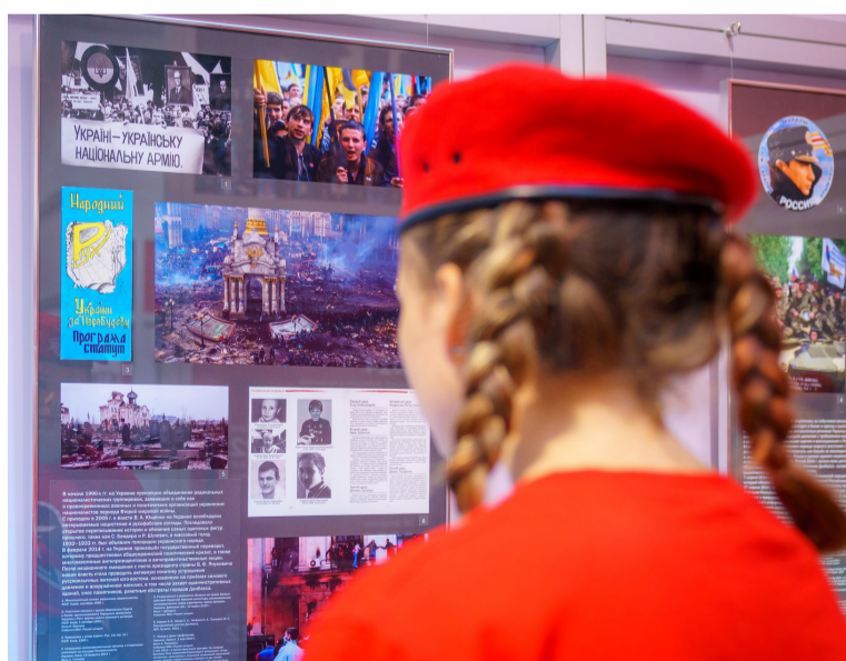
Выставка дополнена информацией о героях СВО