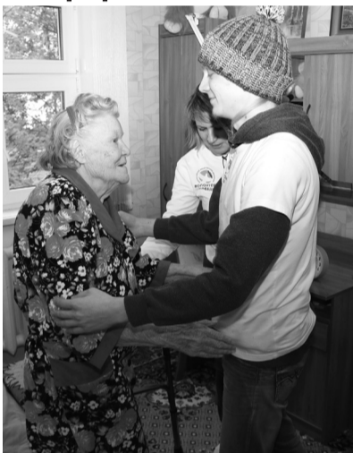
Благотворительный фонд «Память поколений» передал

В минувшие выходные волонтеры Победы Когалыма вочию увидели результаты акции «Красная гвоздика», которую они проводили ранее.