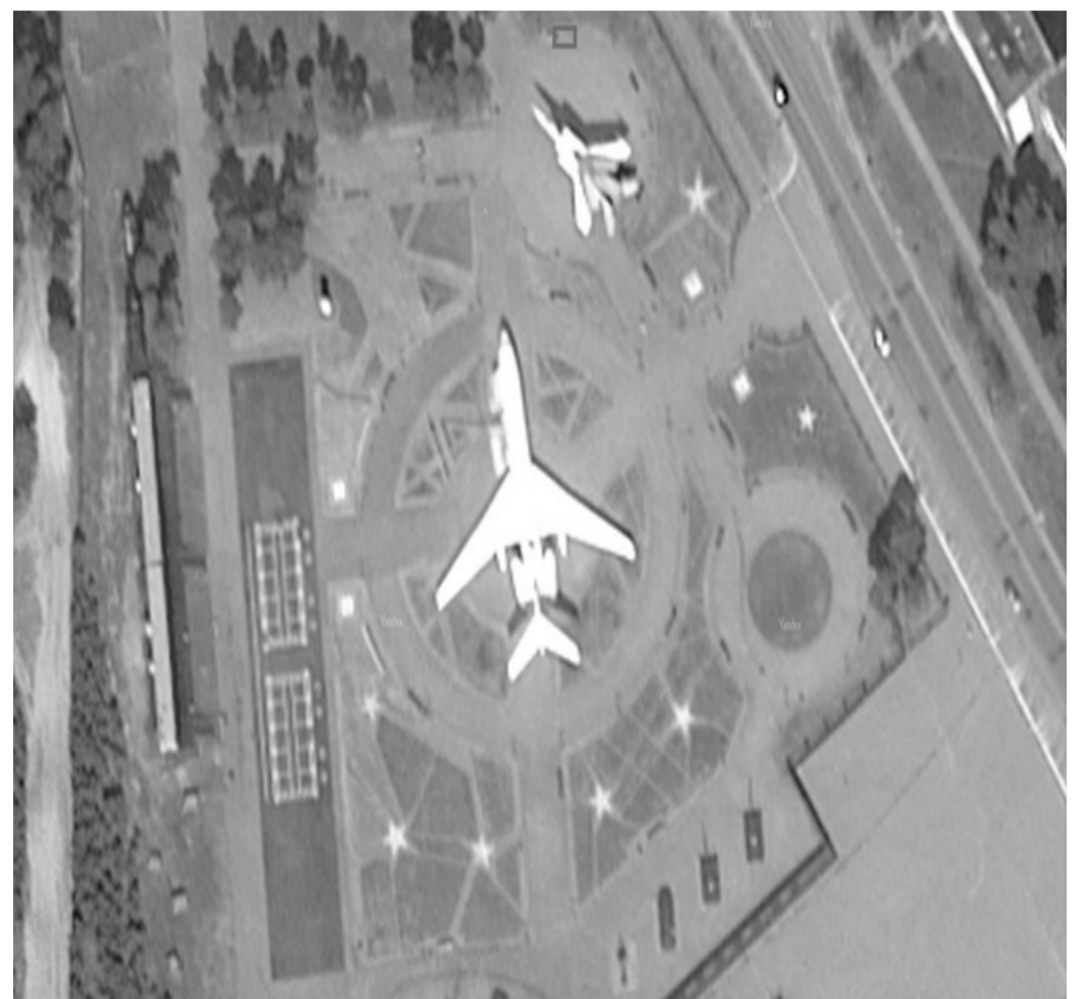
□ - объект торговли

Торговая палатка расположенная по адресу: город Когалым, город Когалым, зона отдыха по улице Сибирской