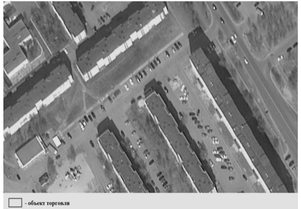
□ - объект торговли

Торговый павильон расположенный по адресу: город Когалым, в районе жилого дома №26А, по ул. Дружбы Народов