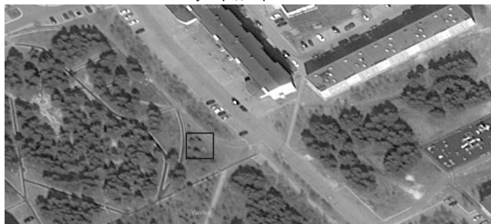
□ - объект торговли

Приложение №1 к сведениям о предмете (лоте) аукциона на 14.06.2023 Торговый павильон расположенный по адресу: город Когалым, в районе дома 8А по ул. Градостроителей