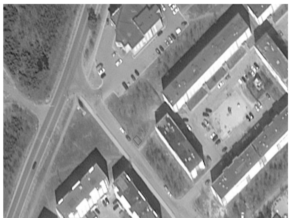
□ - объект торговли

Торговый павильон расположенный по адресу: город Когалым, в районе ТЦ «Лайм» по ул. Прибалтийская, 41