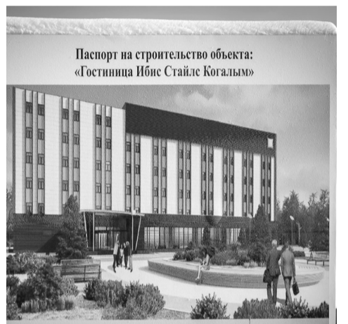
Паспорт на строительство объекта: «Гостиница Ибис Стайле Когалым»

- В Когалыме созданы производственные, социальные объекты, уникальные научные центры, которые сегодня с применением современных цифровых технологий управляют огромными месторождениями, - отметил президент ПАО «ЛУКОЙЛ» Вагит Алекперов.