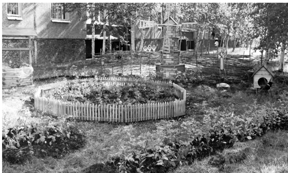
В силах каждого югорчанина сделать свой двор лучше

Кроме того, в работу по облагораживанию городов и поселений региона включилась партия «Единая Россия», которая собирается изменить облик округа с помощью федерального проекта «Городская среда». Сейчас любой югорчанин может подать заявку на благоустройство родного города или поселения. Для этого нужно зайти на сайт