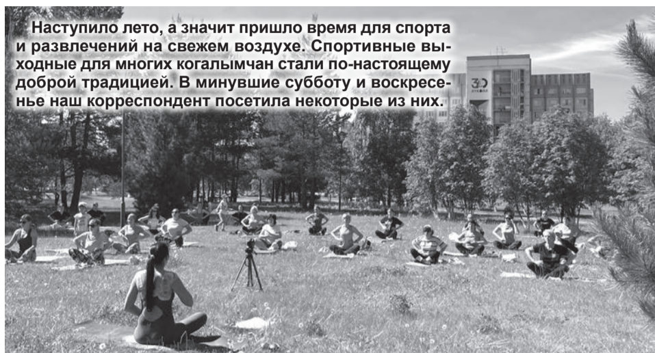
Наступило лето, а значит пришло время для спорта и развлечений на свежем воздухе. Спортивные выходные для многих когалымчан стали по-настоящему доброй традицией. В минувшие субботу и воскресенье наш корреспондент посетила некоторые из них.

В субботу на спортивной площадке во дворе дома 34 по улице Мира был проведен бесплатный танцевальный мастер-класс в стиле High heels, в котором мог поучаствовать любой желающий.