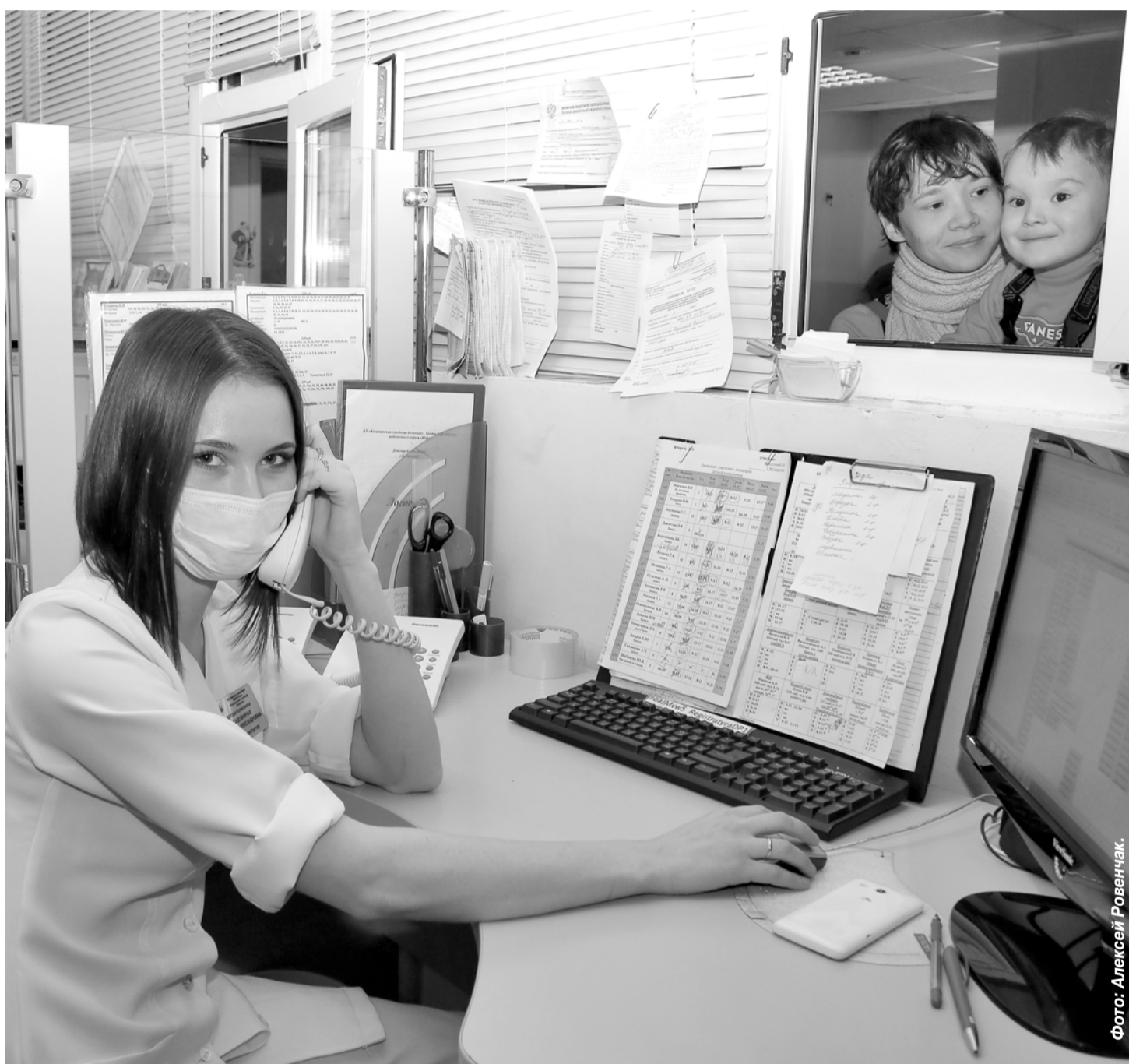
Фото: Алексей Ровенчак.