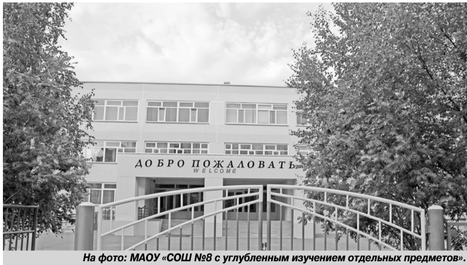
На фото: МАОУ «СОШ №8 с углубленным изучением отдельных предметов».

ральных улиц города, однако она пользуется заслуженным вниманием жителей. В 1998 году на Янтарной была открыта мечеть. Она расположена в самом конце улицы, в живописном природном уголке. Минарет возвышается над подступающими вплотную соснами. Примечателен и тот факт, что во время строительства ни одно дерево не было срублено. С местного автовокзала ежедневно отправляются на работу нефтяники. Школа номер восемь ежегод-