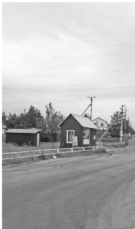
График работы: понедельник-пятница с 8:00 до 20:00, суббота - с 8:00 до 18:00, воскресенье - выходной. Телефоны для справок: 2-48-56, 2-48-86.

Архивный отдел Администрации города Когалыма сообщает, что на основании взаимодействия между Центром государственных и муниципальных услуг «Мои документы» (ранее МАУ «МФЦ») и архивным отделом Администрации города Когалыма по вопросу предоставления архивных справок, копий архивных документов вы можете также обращаться в Центр государственных и муниципальных услуг «Мои документы» по адресу: ул. Мира, 15.