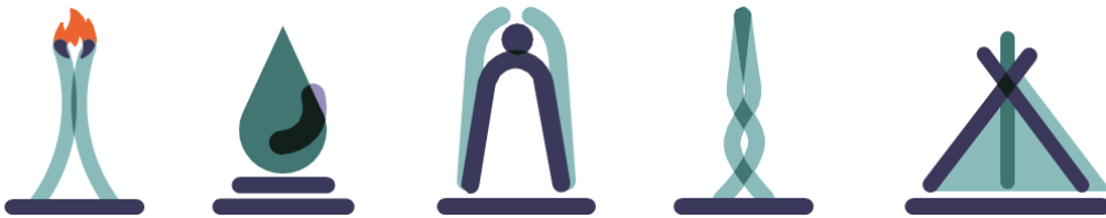
Пиктограммы, символизирующие дифференциаторов города Когалыма

Бренд города Когалыма повышает узнаваемость города, отличает его от других населенных пунктов России, помогает создавать положительный и позитивный образ города. Продвижение города во внешней среде, поддержание престижа и притягательности города несет прямую выгоду жителям города в виде дополнительных возможностей получения дохода, самоидентификации во внешнем мире, для города, как экосистемы, ведет к созданию дополнительных рабочих мест, активизации предпринимательской и творческой деятельности, увеличению поступлений в местный бюджет, росте доходов населения.