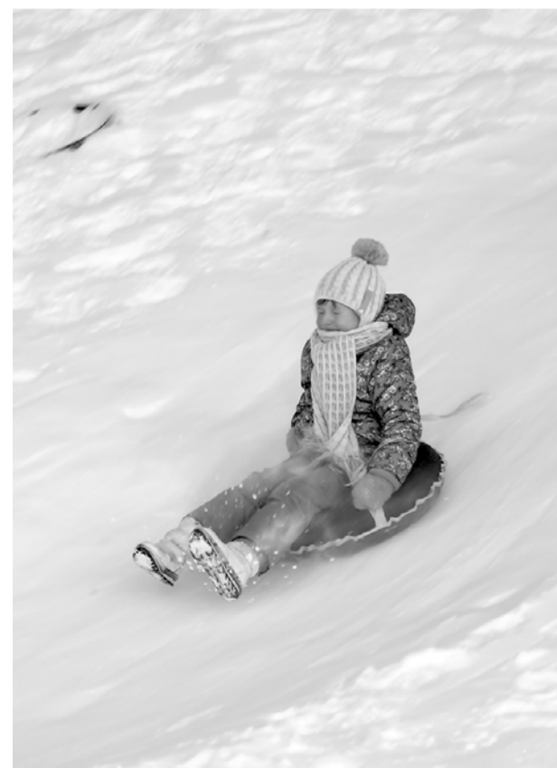
Фоторепортаж подготовил Алексей Ровенчак.