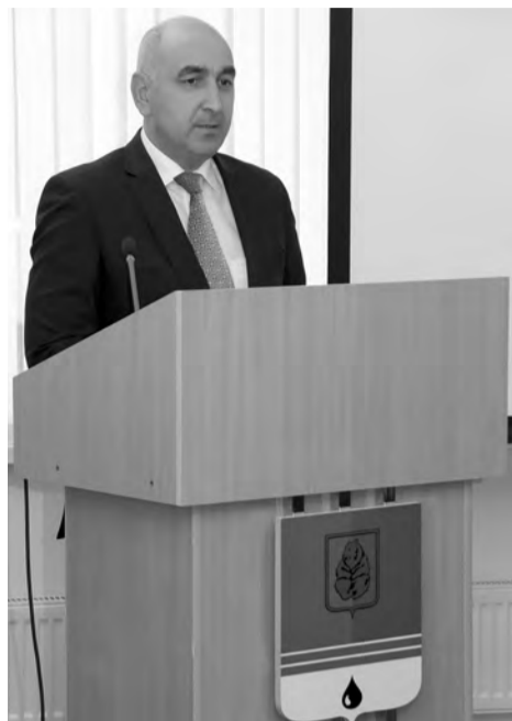
Уважаемые коллеги, инвесторы, предприниматели и жители города Когалыма!

Деятельность органов местного самоуправления города Когалыма в сфере инвестиций и развития предпринимательства является неотъемлемой частью инвестиционной политики, проводимой Правительством ХМАО-Югры.