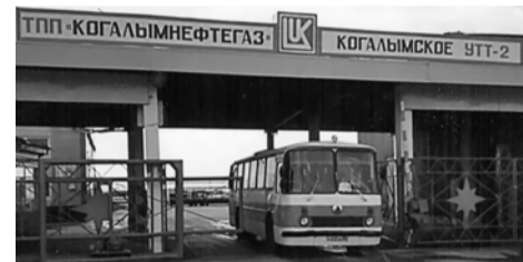
Общий вид въезда на главную территорию Управления технологического транспорта №2 (УТТ-2) «Когалымнефтегаз».

рет свое начало с апреля 1984 года, когда управление технологического транспорта Повховского управления буровых работ перестало существовать, дав жизнь двум новым управлениям технологического транспорта. Изначально распределены между ними роли: УТТ-1 использовалось для грузовых перевозок, а УТТ-2, как тогда, так и теперь, - в основном для пассажирских. Второе управление технологического транспорта тогда располагало не более чем сотней единиц техники. Вахты перевозились «Кавзика-