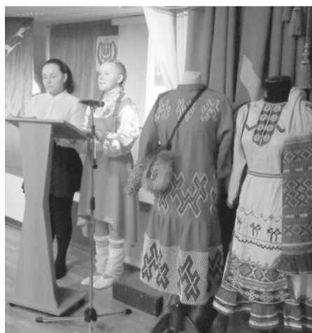
Страницу подготовила Елена Алексеева.