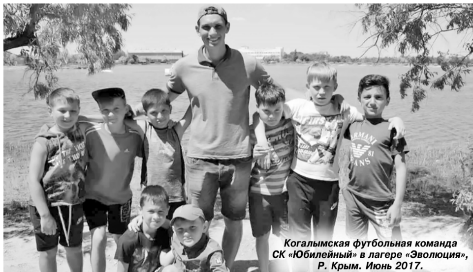
Когалымская футбольная команда СК «Юбилейный» в лагере «Эволюция», Р. Крым. Июнь 2017.