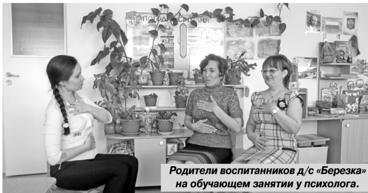
Родители воспитанников д/с «Березка» на обучающем занятии у психолога.

Представьте картину. Папа с дочкой идут из детсада домой, четырехлетняя малышка бежит вприпрыжку за папой, таким большим и сильным, протягивая ему листочек с рисунком: «Папа, папа, посмотри какие красивые, вкусные фрукты я нарисовала! Лучше всех!». Папа идет не оглядываясь, он погружен в свои тяжкие и такие «важные» мысли. Что хочет здесь девочка? Все просто - она сегодня в детском саду выучила и запомнила, что такое фрукты, их отличие от овощей (не правда ли важное открытие для маленького человека?), у нее хорошо развита мелкая моторика (нарисовала лучше всех!). Девочка хочет признания своих достижений (мы же все этого хотим) от одного из самых могущественных, в ее понимании, и важных людей. Но что же она получила в ответ? Лишь безразличие, а если папа еще и отмахнется от нее со словами: «Отстань,