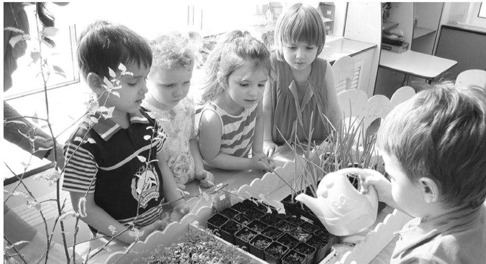
В «Уголках здоровья» дети получают знания валеологического характера. Здесь накоплен богатый материал: дидактические игры и пособия по культуре поведения, ведению здорового образа жизни, соблюдению правил безопасного поведения и правил личной гигиены.

ровые, финансовые, материально-технические, то и реализация ФГОС будет проходить успешно. Именно такой пример создания условий для развития детей в свете требований ФГОС дошкольного образования мы можем наблюдать в МБДОУ центр развития ребенка детский сад «Сказка», который впервые распахнул свои двери для дошколят Когалыма в 1985 году и с тех пор ежегодно принимает в свои стены 260-270 ребят от полутора до семи лет.