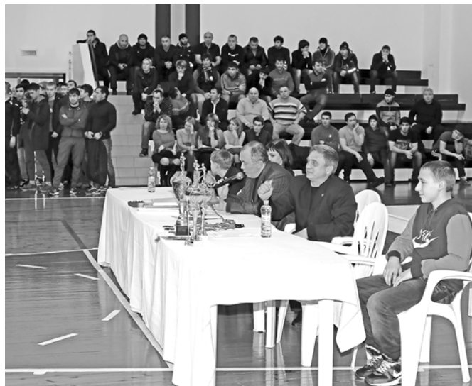
Фоторепортаж подготовил Алексей Ровенчак. Фото автора.