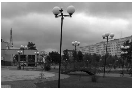
БЫПО Когалым Администрация