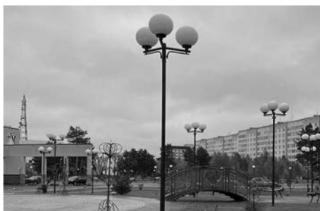
СТАПО Когалым Администрация