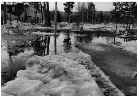
БЫПО Когалым Администрация

Жалоба была передана в профильную службу. Уровень плит на тротуаре подняли, теперь лужи в этом месте не будет.