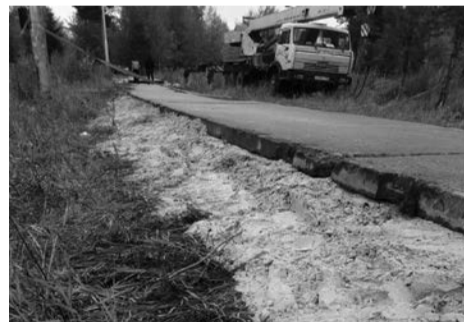
СТАПО Когалым Администрация