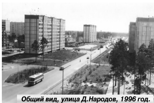
Общий вид, улица Д. Народов, 1996 год.

...Улицы - это не только лицо города, это наше с вами лицо... Улица Повха. Улица Степана Повха. Улица, увековечившая имя человека, отдавшего городу часть жизни, положившего здесь начало нефти. Улица историческая, потому что Степан Повх - это