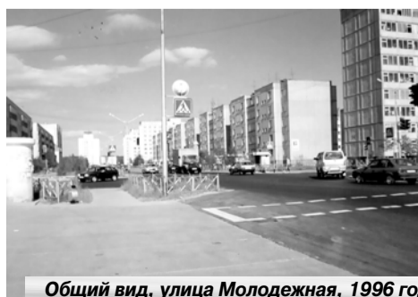
Общий вид, улица Молодежная, 1996 год.

...На сегодняшний день мы живем и работаем нормально: производим погрузку до 300 вагонов ежедневно, а выгружаем до 60-70 вагонов. Коллектив станции верит в хорошее будущее и стремится, чтобы в этом будущем все было лучше, чем в настоящем. Недавно мы закончили ремонт путей на перегоне Когалым-Кумалей. Уже начинаем готовиться к зиме: сейчас производим ремонт теплотрассы. К сентябрю на станции должно произойти открытие кафе-магазина, где пассажиры будут иметь возможность перекусить и отдохнуть... Если раньше и были проблемы с перевозкой